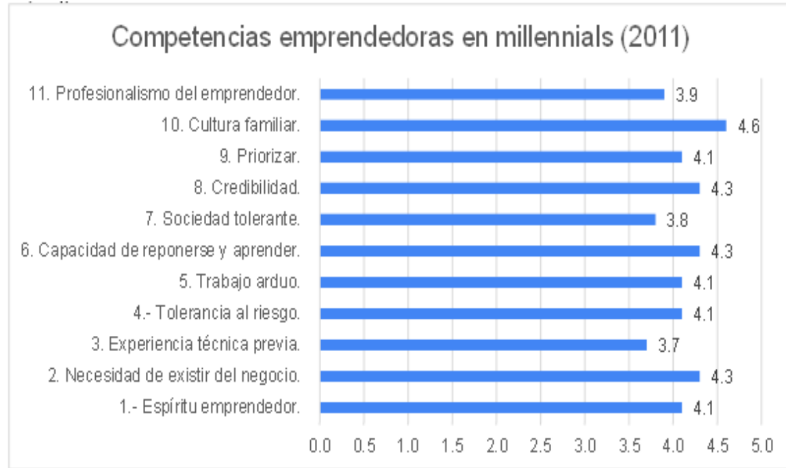
Figura 1. Competencias emprendedoras de los jóvenes Millennials. Datos de la investigación.