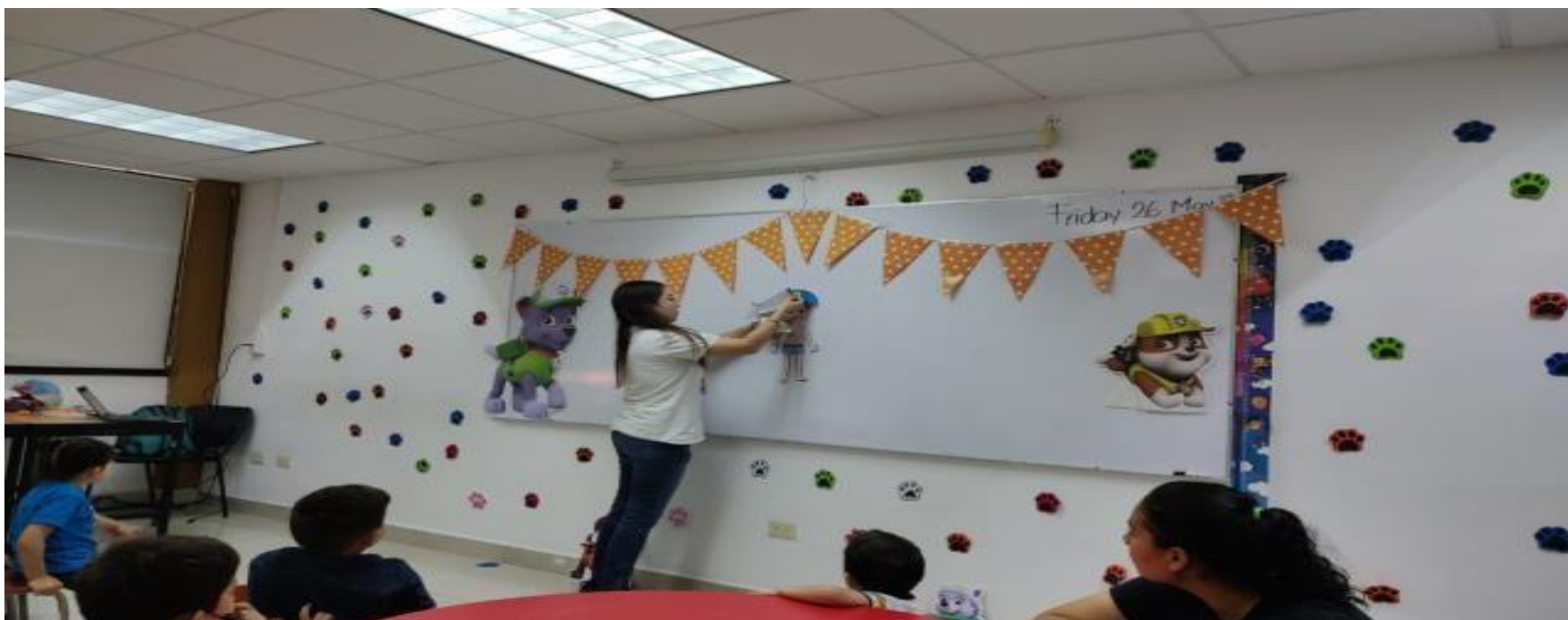
Desarrollo de Secuencia Didáctica (Preescolar), Mañana de Trabajo , mayo 2023.