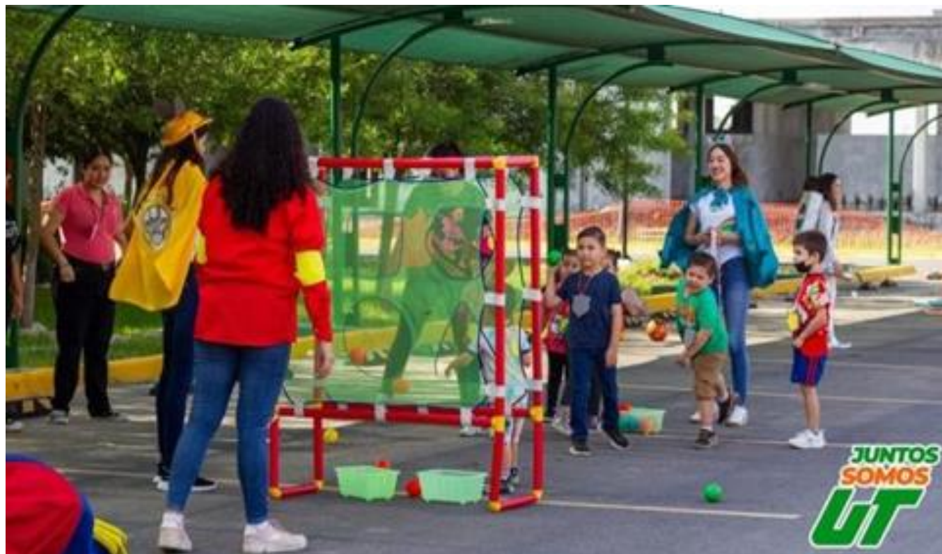
Activación Física. Mañana de Trabajo, mayo 2023